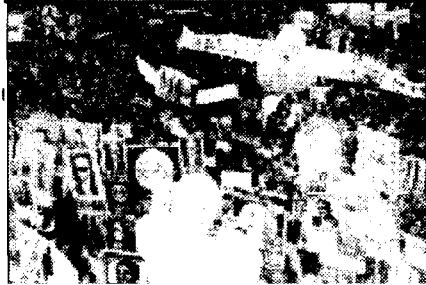
Da sinistra in senso orario. 1928, i calciatori del Napoli; anni '30, Eduardo De Filippo, Armando Falconi e Raffaele Viviani; anni '50, un comizio di Achille Lauro in piazza del Plebiscito