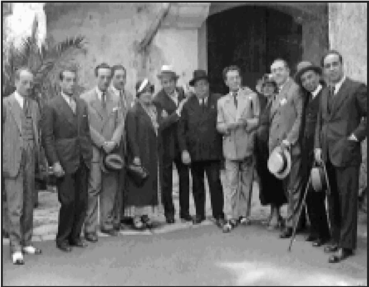
FOTO DEGLI ANNI TRENTA: SI RICONOSCONO PEPPINO ED EDUARDO DE FILIPPO, LIBERO BOVIO, RAFFAELE VIVIANI E TITINA DE FILIPPO